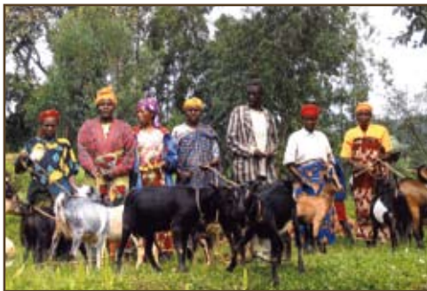
Geiten voor weduwen en weeskinderen