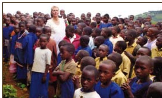
Ria te midden van honderden kinderen